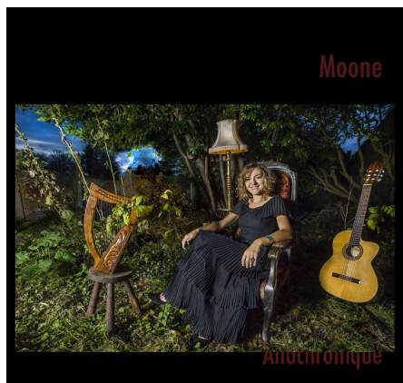
EP - Anachronique